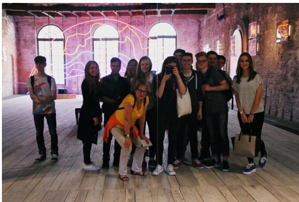
Schülergruppe des GAG auf der Biennale