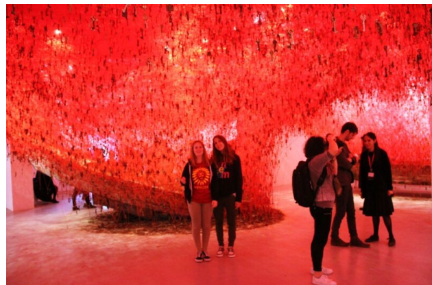
Chiharu Shiota: "The Key in the Hand"